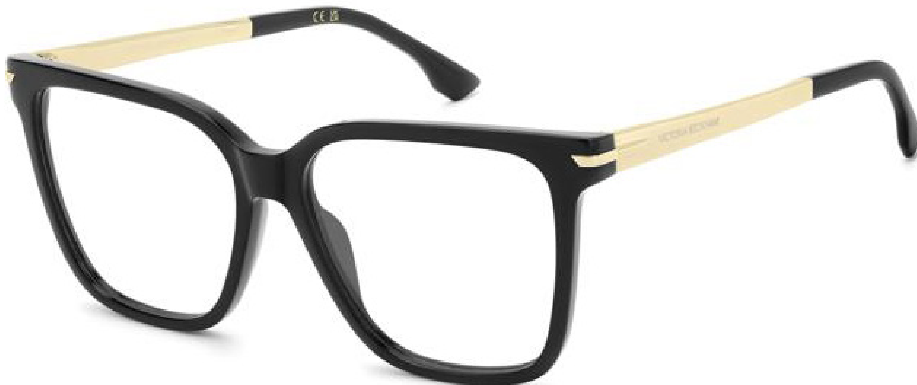
COLOR 2M2-BLACK GOLD