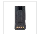
Batería de polímero de litio 3000mAh