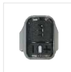
PTT de anillo inalámbrico BT