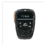
BT Micrófono altavoz inalámbrico a distancia