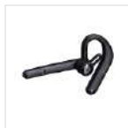
Auricular inalámbrico BT