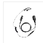
Auricular con cable