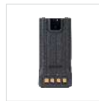
Batería de polímero de litio 2000mAh