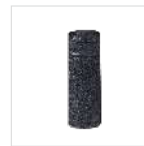
Clip para cinturón