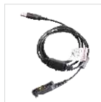
Cable de programación (USB)