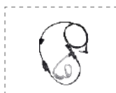
Auricular con cable