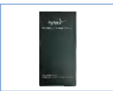
Batería de Li-ion