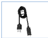
Cable de datos