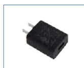
Adaptador de corriente