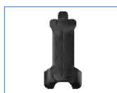
Clip para cinturón